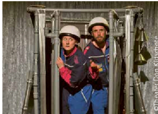
Nix wie weg - Schnick & Schnack heben ab 13. bis 15. November