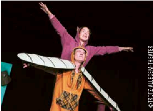
Maunz und Wuffs guter Tag 30. Januar bis 01. Februar