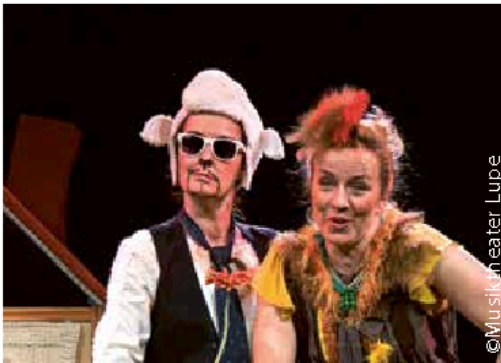
Wolle und Gack 09. bis 11. Oktober