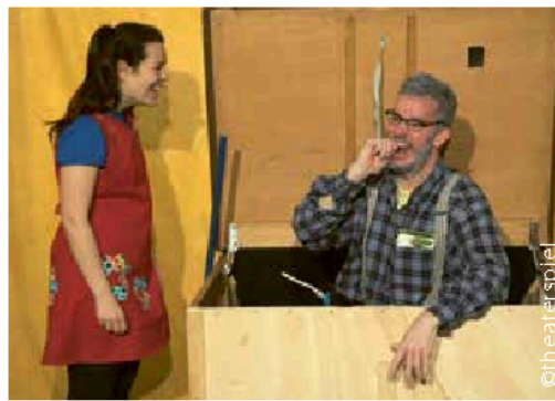
Ein bärenstarkes Fest 22. bis 24. Mai