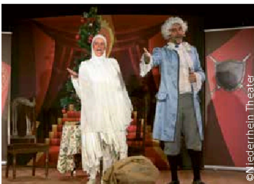
Der kleine Weihnachtsgeist 11. bis 13. Dezember