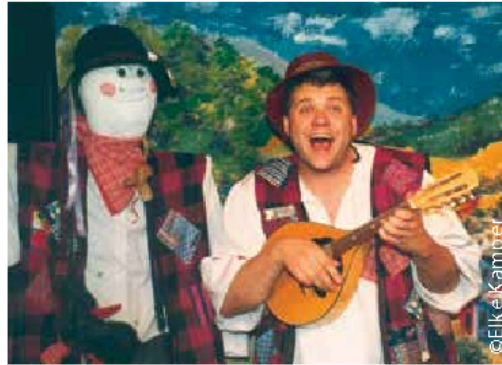
Der Krachmacher 20. bis 22. Februar