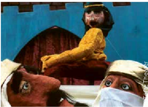
Das Kamel aus dem Fingerhut 27. bis 29. März